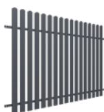
PRZEŚŁO wys. 1,2 m

Szerokość: 200 (202)* cm Wysokość: 120 cm Profil sztachetek: 68 x 13 mm Ilość sztachetek: 17 Profil ramy: 40 x 40 mm