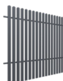
PRZEŚŁO wys. 1,5 m

Szerokość: 200 (202)* cm Wysokość: 120 cm Profil sztachetek: 68 x 13 mm Ilość sztachetek: 17 Profil ramy: 40 x 40 mm