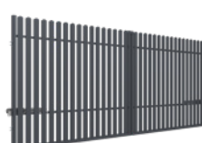
BRAMA DWUSKRZYDŁOWA Z AUTOMATEM 4m

Szerokość: 400 (404)* cm Wysokość: 150 cm Profil sztachetek: 68 x 13 mm Ilość sztachetek: 34 Profil ramy: 40 x 40 mm