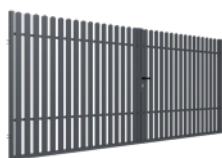
BRAMA DWUSKRZYDŁOWA 4m

Furtka zawiera: szyld, kłamekę, zamek, wkładkę.