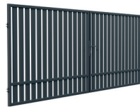
BRAMA DWUSKRZYDŁOWA 4m

Szerokość: 200 (202)* cm Wysokość: 120 cm Profil sztachetek: 80 x 20 mm Ilość sztachetek: 14 Profil ramy: 40 x 40 mm Kod: 631342