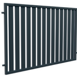
PRZĘŚŁO 1,2 m

Szerokość: 200 (202)* cm Wysokość: 120 cm Profil sztachetek: 80 x 20 mm Ilość sztachetek: 14 Profil ramy: 40 x 40 mm Kod: 631342