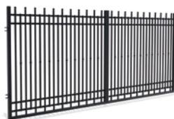
BRAMA DWUSKRZYDŁOWA 4m

Szerokość: 200 (202)* cm Wysokość: 130 cm Profil sztachetek: 18 x 18 mm Ilość sztachetek: 21 Profil ramy: - Profil poprzeczki: 25 x 15 mm