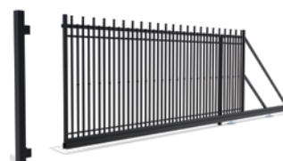
BRAMA PRZESUWNA** prawa/lewa

Szerokość: 600 (400)* cm Wysokość: 159 cm Profil sztachetek: 18 x 18 mm Ilość sztachetek: 45 Profil ramy: 40 x 40 mm Profil poprzeczki: 25 x 15 mm