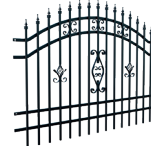
PRZESĘŁO wys. 145 cm

Szerokość: 200 (202)* cm Wysokość: 145 cm Profil sztachetek: 18 x 18 mm Ilość sztachetek: 15 Profil poprzeczki: 25 x 15 mm Kod: 624273