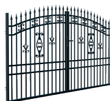
BRAMA DWUSKRZYDŁOWA 3,5 m

Furtka zawiera: szyld, klamkę, zamek, wkładkę.